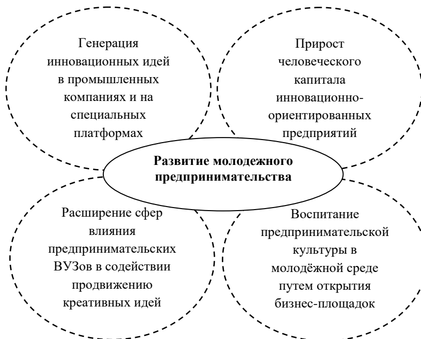
Рисунок 2 – Области развития молодежного предпринимательского движения (с использованием [5 – 7])

Делая акцент на активном использовании базовых принципов юнит-экономики, мы не можем обойти вниманием сферы влияния «экономики знаний», которая неразрывным образом связана с молодежным предпринимательством. На рисунке 2 обозначены приоритетные области развития молодежного предпринимательского движения, без которых не представляется будущее нашей страны.