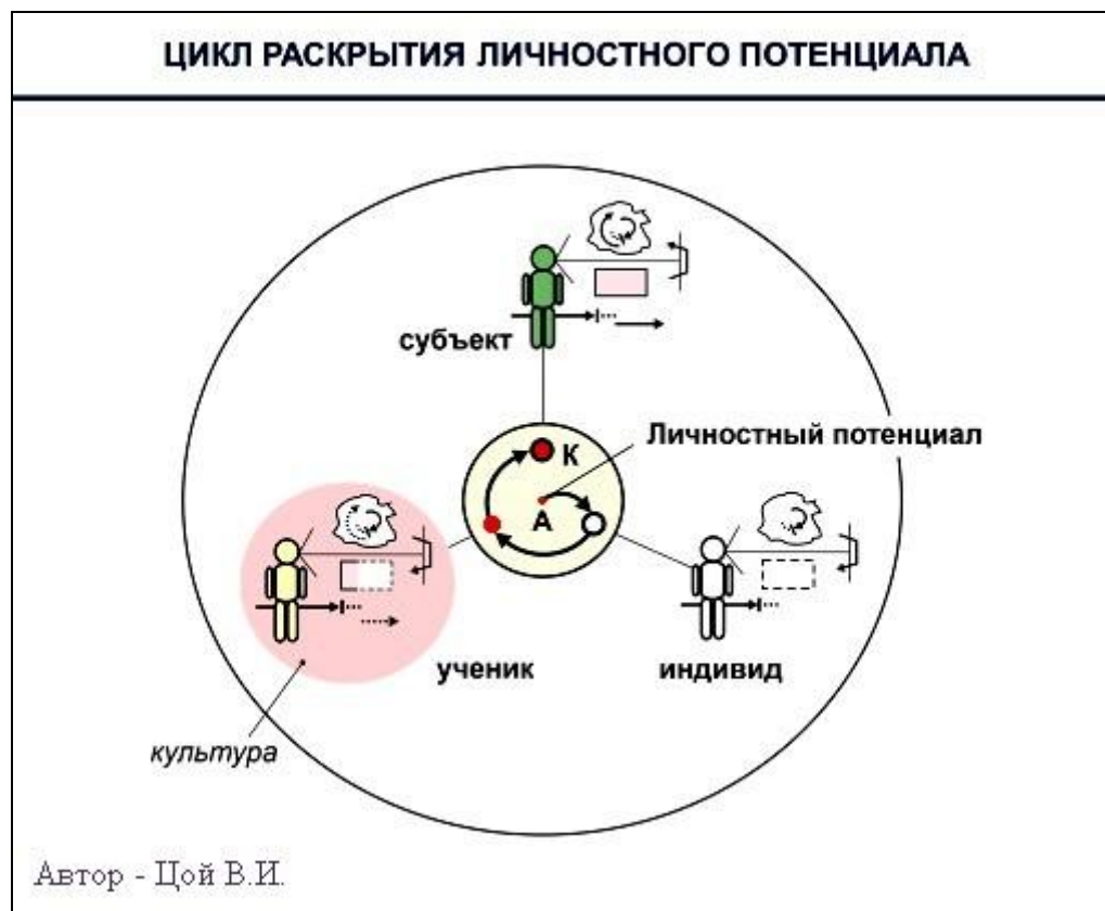
Рисунок 2 – Диалектические факторы раскрытия личности

«клеточки» модель системного объекта с разворачивающейся в логике ВАК функцией (рисунок 2). Образующаяся спираль представляет собой механизм последовательного проявления и совмещения функциональной формы, функциональной морфологии и функциональной целостности объекта (совмещённого состояния формы и морфологии) [9].