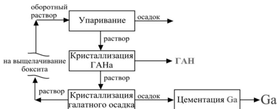
Рисунок 2 – Схема технологии получения галлия