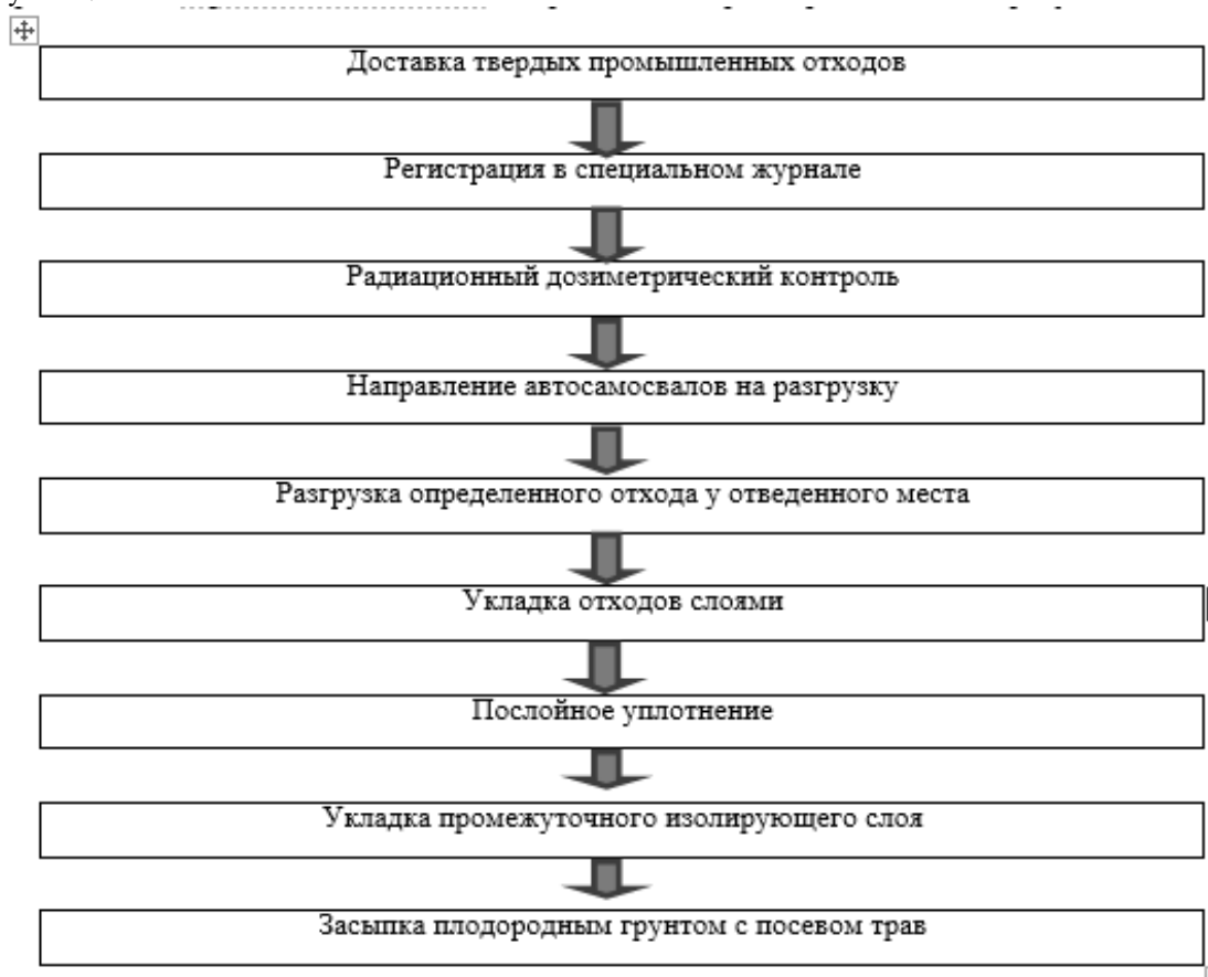
Рисунок 1 – Схема технологических операций при эксплуатации полигона для промышленных отходов

Технологические операции, выполняемые при эксплуатации полигона для промышленных отходов, имеют определенный порядок, схематическое изображение которого представлено на рисунке 1.